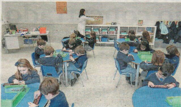
Alumnos de 3º de Infantil trabajando con el método Ucmas.