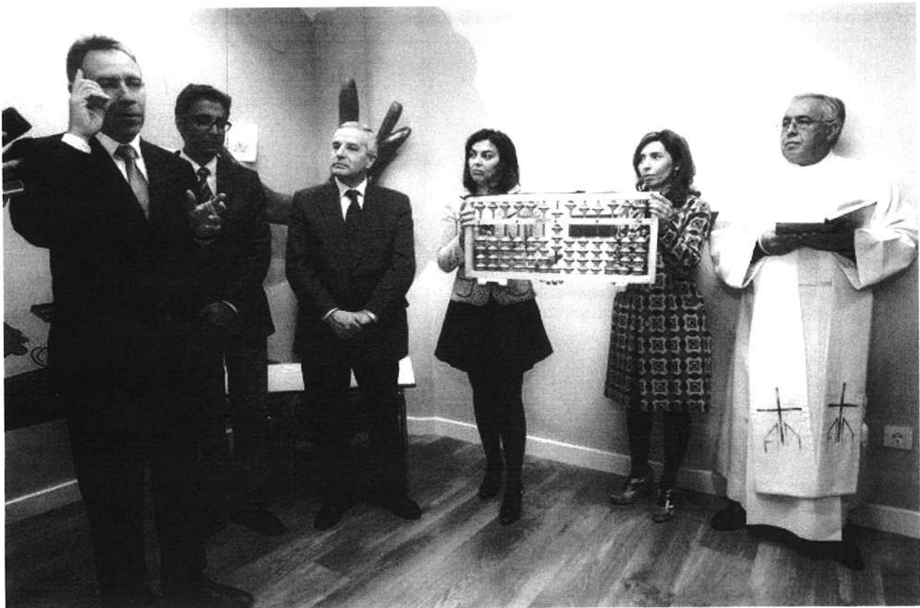
Inauguración del primer centro UCMAS en Castilla y León.

Un innovador programa de desarrollo intelectual integral basado en el ábaco, dirigido a niños de edades comprendidas entre los 5 y los 13 años y que asegura el éxito académico en el tránsito de primaria a secundaria. De esta forma, el método deja al margen el lenguaje de los números para conseguir que los niños trabajen con un ábaco que posteriormente tendrán que dibujar en su mente.